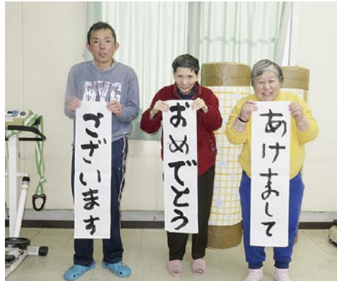
書道クラス 書初め