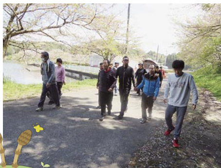
スポーツクラス、公園で散歩風景