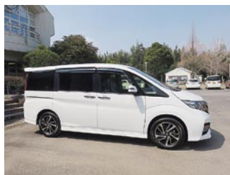
ホンダ ステップワゴン▶

平成28年12月20日にマツダの軽自動車「スクラム」 平成29年3月30日にホンダの「ステップワゴン」が納車されました。